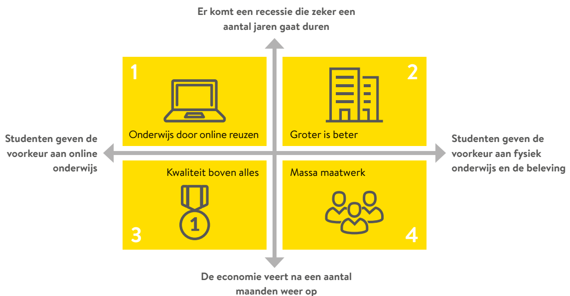
Figuur 3. Vier toekomstscenario's voor het onderwijs

In dit scenario ontstaat er een grote, wereldwijde recessie met grootscheepse bezuinigingen op onderwijs. Studenten geven de voorkeur aan online onderwijs, deels uit gemak, deels uit angst voor de volgende coronagolven. Door de bezuinigingen verzwakt de financiële positie van onderwijsinstellingen. Vanuit kosten oogpunt en vanwege de wensen van studenten, kiezen onderwijsinstellingen ervoor voornamelijk online les te geven. Persoonlijke, een-op-een begeleiding wordt ingeperkt tot het hoognodige