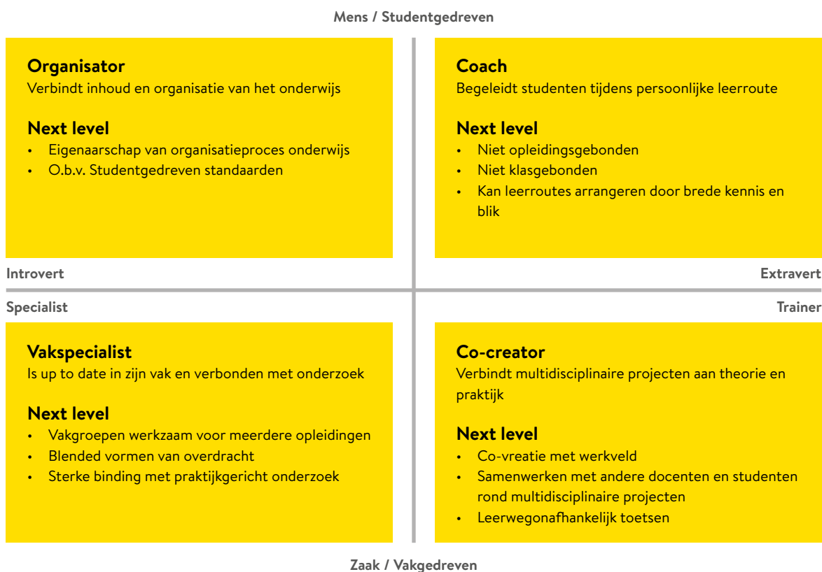
Figuur 4. Verschillende docentrollen