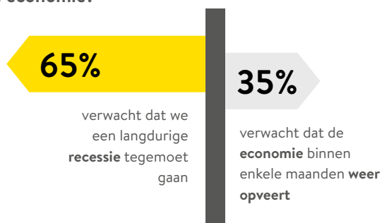
Figuur 1. Welk effect heeft de coronacrisis op de economie?

De langetermijneffecten van de coronacrisis op de economie zijn nog onzeker. Het kabinet heeft een groot aantal maatregelen getroffen om de economie draaiende te houden. Maar de effecten op de mondiale economie zijn nog onzeker. Krijgen we een wereldwijde economische crisis? Of veren de grootste economieën weer snel op? De tweederde van de respondenten uit ons onderzoek verwacht een recessie (zie figuur 1) 3 . De dreiging van bezuinigingen vanuit overheid en bedrijven, het effect daarvan op de arbeidsmarkt en de vrees dat het coronavirus weer oplaat, zorgen voor blijvende onzekerheid.